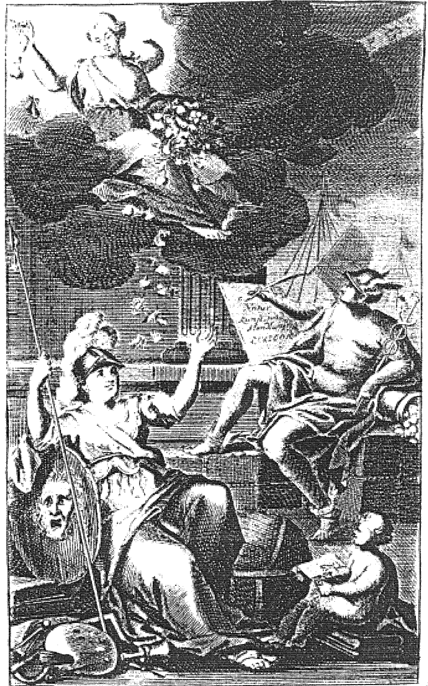
Abbildung 3: Verleger warben im 17. und 18. Jahrhundert für ihre Bücher mit ausführlich gestalteten Textseiten und auch mit Frontispizen, d. h. Kupferstichen vor dem Titel. Manchmal findet man ein Autorporträt, manchmal den Versuch, das Thema des Buches zu illustrieren. Schwierig war dies bei neuartigen Bucharten wie dem Reallexikon, das erstmals 1712 in Leipzig erschien. Was führt die Figuren auf diesem Bild zusammen?

Ganz vordergründig beherrscht Minerva die Szene, denn sie ist im irrealen Raum des Frontispizes prominent plaziert und symbolisiert ganz einfach das Wissen. Sie hebt die Arme, als ob sie sagen wollte: „So groß ist mein Reich der Kenntnisse!“ Sie ist mit allen Insignien ihrer griechischen Definition ausgestattet, gerüstet inklusive Helm, zusätzlich geschützt durch den Schild samt Haupt der Medusa und bewehrt mit dem Speer. Das Bild einer selbstsicheren Frau. Jeder Leser wußte Bescheid: Aha, Minerva (griechisch: Pallas Athene)! Die Pose der Figur spiegelt ihre Bedeutung, sie scheint ihre eigene Wichtigkeit zu verkörpern. Merkur sitzt anders, nicht so selbstverliebt, denn sein Blick schweift ab und verrät: Er wird es nicht lange in dieser Pose aushalten. Auch er zeigt alle Insignien seiner griechisch-mythologischen Identität,