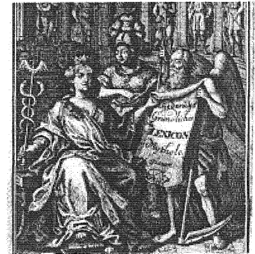
Abbildung 1: Frontispiz aus Jacques Savary des Bruslons: Dictionnaire Universel de Commerce, Paris 1750 [1. Auflage 1723].