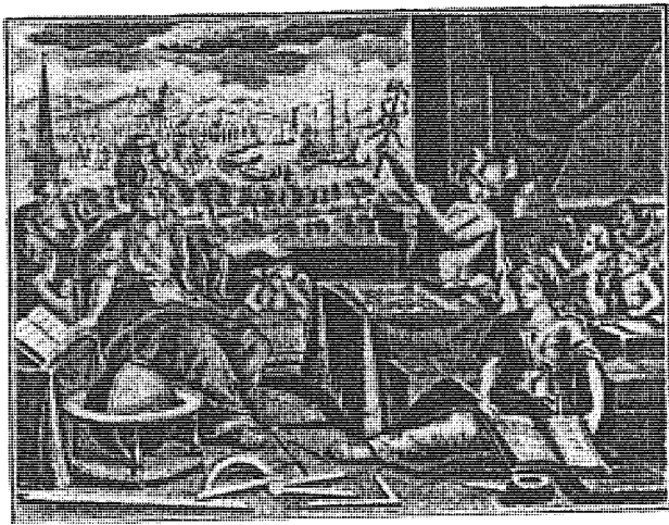
Abb. 5: Im Universal-Lexicon (1732–1754) des Leipziger Verlegers Johann Heinrich Zedler finden sich Merkur und Minerva ebenfalls in Szene gesetzt; sie versinnbildlichen hier zusammen mit allem anderen, was im Raum sichtbar ist, die Fülle der im Lexikon angebotenen Kenntnisse.

tung und symbolisieren ein aufgeteiltes und wieder zusammensetzbares Wissen.