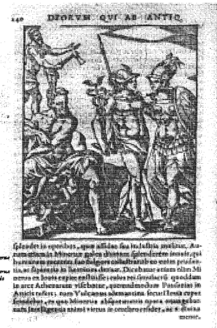
Abb. 4: Cartaris Imagines deorum waren seit dem 16. Jahrhundert durch die Holzschnitte vieler Ausgaben maßgeblich für die Götterdarstellung im Druck.

Reallexikon also zeigt ein bislang unbekanntes Datum der Göttergeschichte, und man mag sich fragen, welche Idee die beiden Protagonisten zusammengezwungen hat.